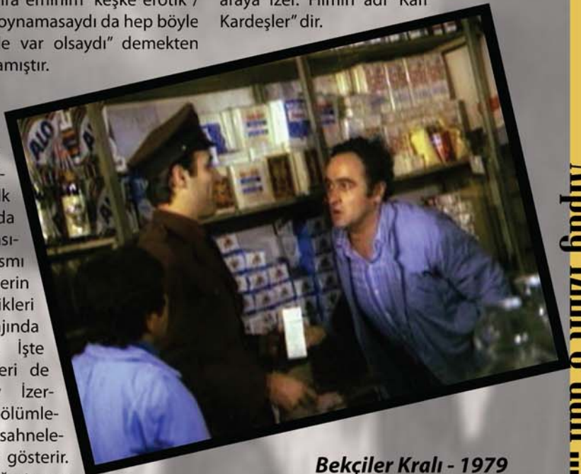
Bekçiler Kralı - 1979

75 yılında oynadığı bu filmin ardından, 76 yılına kadar "Randevu", "Çin İşçi Japon İşçi", "Plaj Horozu", "Yok Devenin Başı", "Canavar Cafer", "Mahallede Şenlik Var", "Leş Kargaları", "Kolombo Şakir", "Arzu Bitmeyen Şarkı" adlı erotik/komedi filmlerinde oynar. 76 yılının sonlarına doğru da, bir adet macera filmi sıkıştırır araya İzer. Filmin adı "Kan Kardeşler" dir.